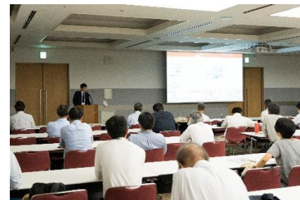
技術講演 第2会場の様子