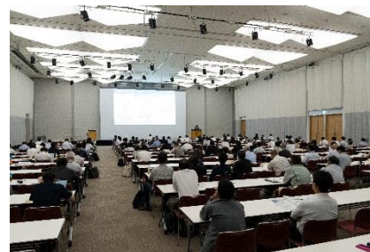
技術講演 第1会場の様子