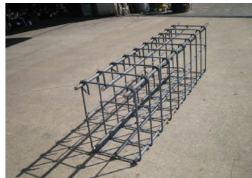
写真-2 現場組み立て 鉄筋スポット先組工法ユニット

本技術は、鉄筋をユニット化することで鉄筋の長さ、ピッチ幅およびかぶり厚さを正確に確保することができ、配筋工事の施工性改善、作業能率向上、省力化を意図して開発されたものである。